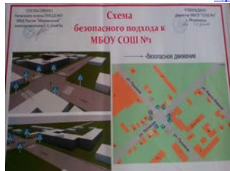
Схема безопасного подхода к школе в фойе