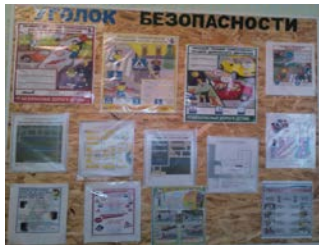
Уголок безопасности в коридоре школы