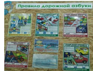
Стенд безопасности ПДД в кабинете ОБЖ