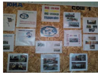
Стенд отряда ЮИД "Виражи"