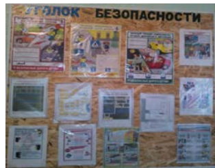
Уголок безопасности в коридоре СОШ №1(корпус2)