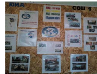
Стенд отряда ЮИД "Виражи" в коридоре СОШ№1(2корпус)