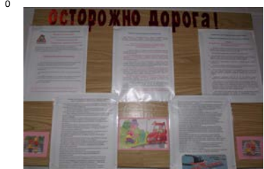
Информационный стенд в фойе СОШ №1 (корпус2)