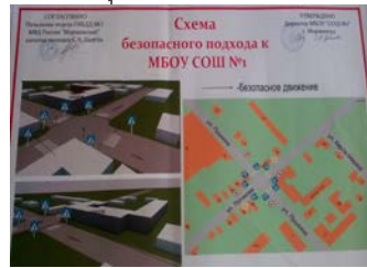
Схема безопасного маршрута в фойе СОШ №1(2корпус)